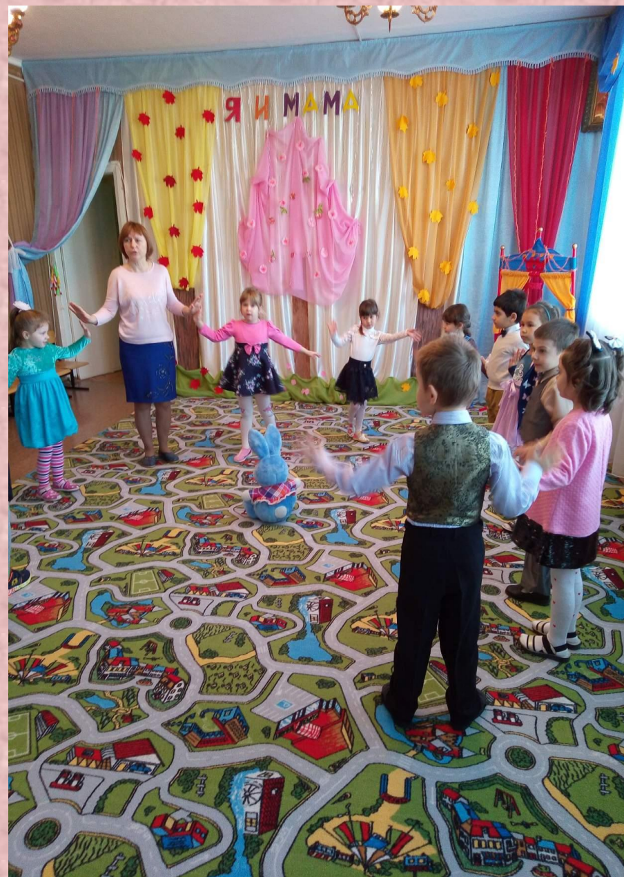
Песня о маме