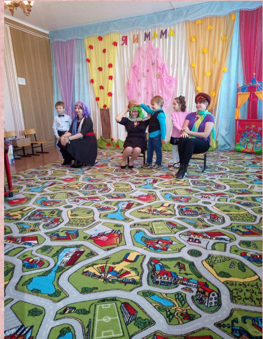
«Наряди свою маму»