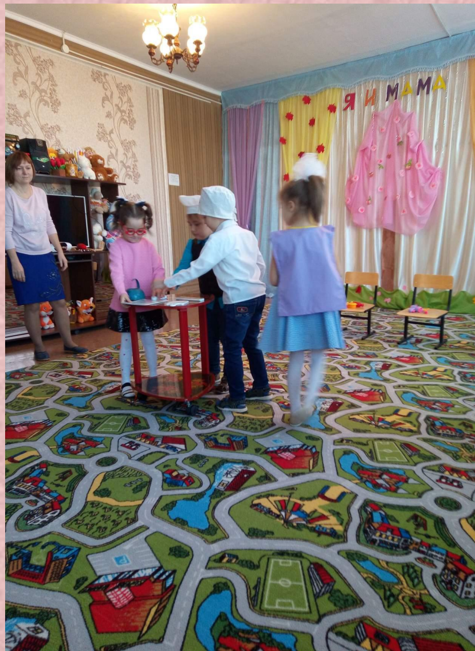
Игра «Вещи для профессий»